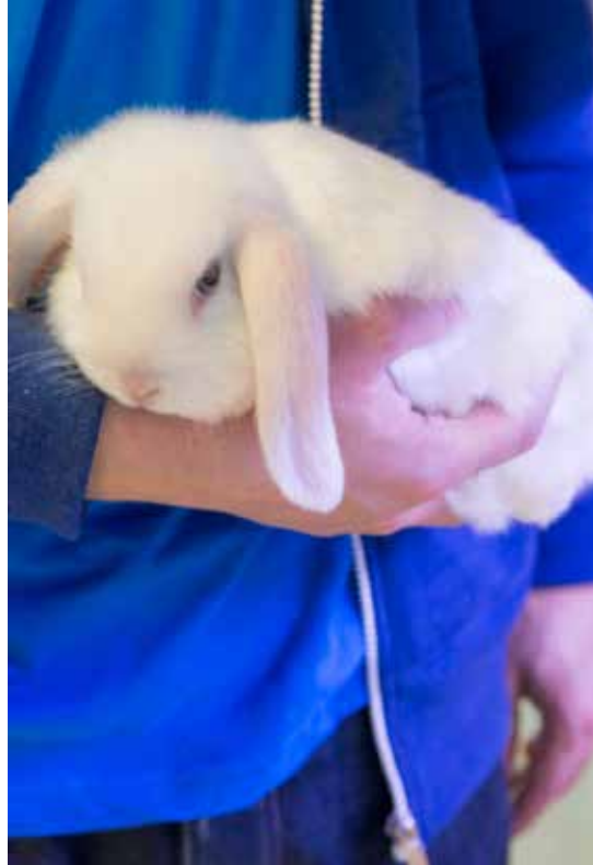
Aktivitetscoacherna i DISA försöker tillmötesgå de önskemål om arbetsträning som deltagarna har, till exempel att få arbeta med djur.

Enligt IPS-modellen fortsätter stödet från arbetscoachen så länge klienten vill. I DISA kvarstår stödet enbart så länge som personen har aktivitetsersättning, vilket i praktiken innebär att stödet upphör när personen fyller 30 år, börjar studera eller får ett arbete. Finns