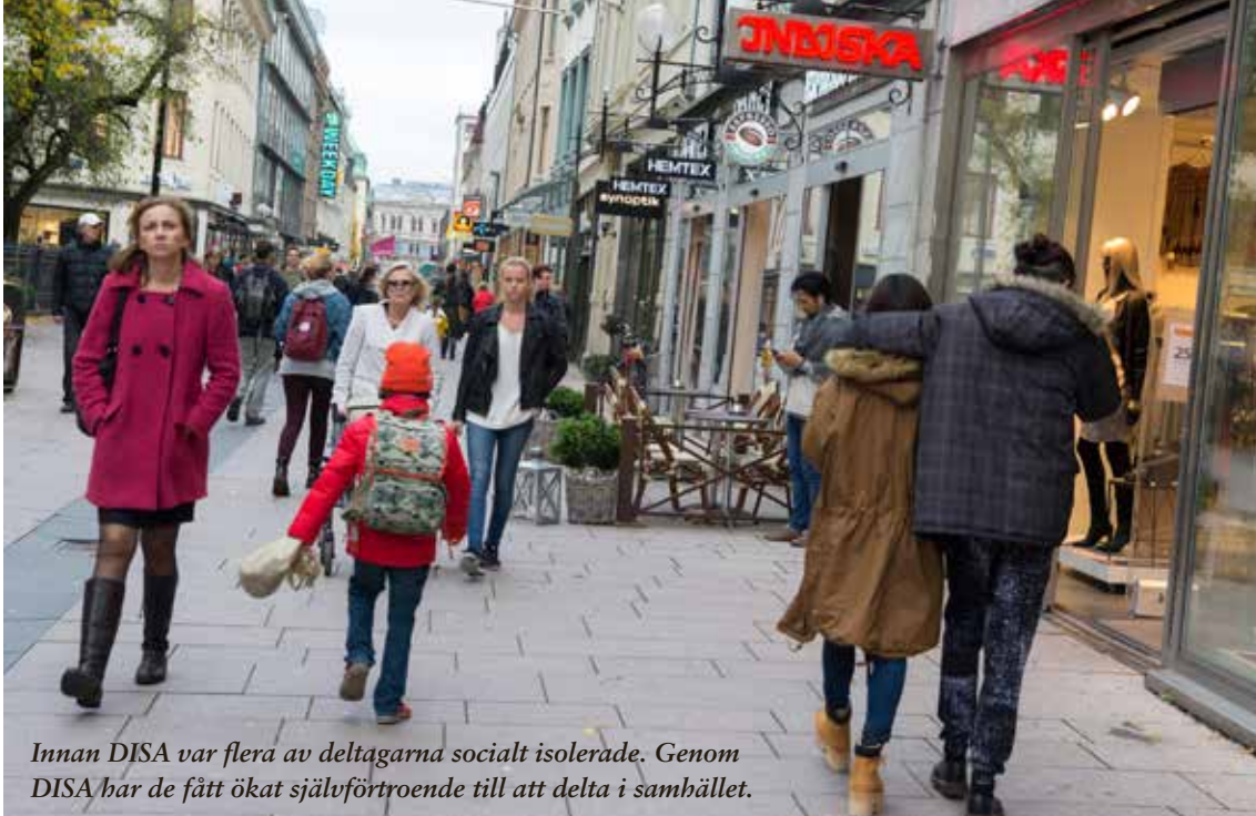
Innan DISA var flera av deltagarna socialt isolerade. Genom DISA har de fått ökat självförtroende till att delta i samhället.