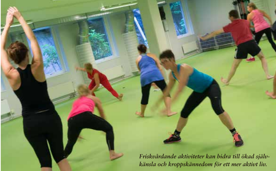
Friskvårdande aktiviteter kan bidra till ökad självkänsla och kroppskänedom för ett mer aktivt liv.

sjukdom och nu får missbruksvård, psykiatrisk rehabilitering eller habilitering.