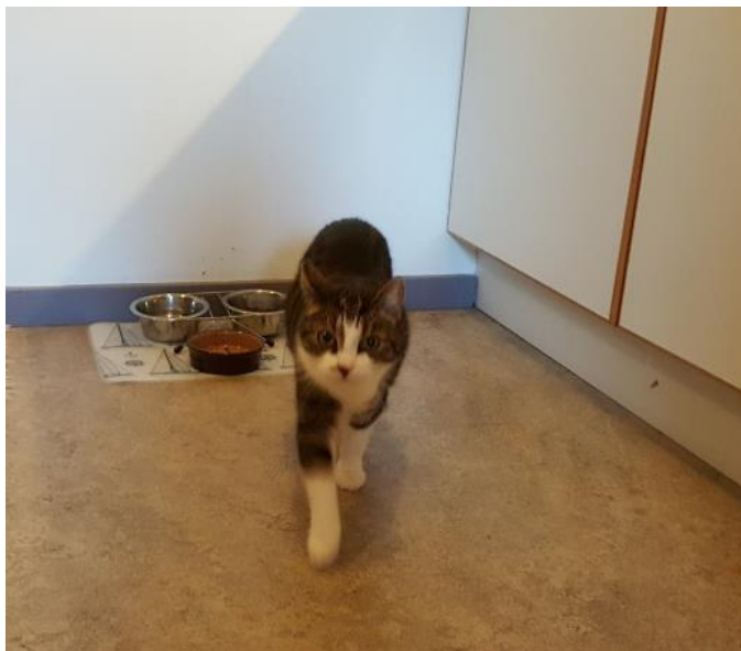
En katt som bor på äldreboendet.

När den terapeututbildade prästen inte längre fanns kvar som samtalsledare tog samtalscirkeln en annan vändning. Den blev något annat i händerna på de nya samtalsledarna. Jag tror att detta beror på att samtalsledare väljer teman som känns bekväma och intressanta att prata utifrån. Kanske var det detta som bidrog till att innehållet kom att variera över tid. Prästerna som ledde samtalet den andra terminen valde att fokusera på existentiella frågor som till exempel människovärdet och yttrandefriheten, vilket är abstrakta teman, medan undersköterskorna ofta valde mer neutrala ämnen som har med den yttre ramen i människors liv att göra – årstidsbundna händelser och högtider. En annan intressant förändring som ägde rum när undersköterskorna tog över rollen som samtalsledare, kanske i kombination med att gruppen blev större, var att samtalet kom att styras mer av de boende själva. Samtalet blev mer av ett sam-tal där olika talare flikade in i varandras utsagor, jämfört med hur det var i början då deltagarna pratade en i taget medan de övriga lyssnade. Tempot och energin i rummet förändrades också med detta.