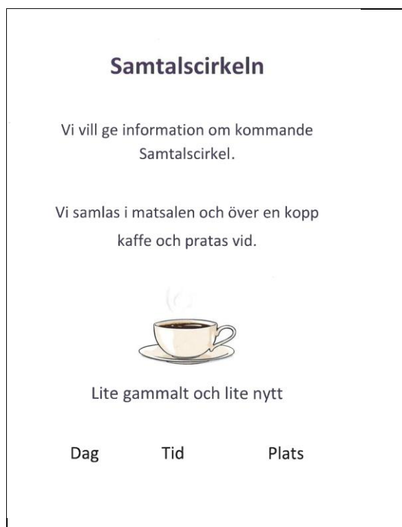
Informationsblad om samtalsstunden.

För att inkludera fler deltagare sattes lappar upp på anslagstavlan och undersköterskorna gick runt och informerade på våningarna över en kopp kaffe. De upplevde att det hade blivit lättare att få deltagare till samtalscirkeln när den hade blivit inarbetad. Men trots att de gick ut med en öppen inbjudan den andra och tredje terminen var det delvis samma personer som fortsatte som hade varit med tidigare.