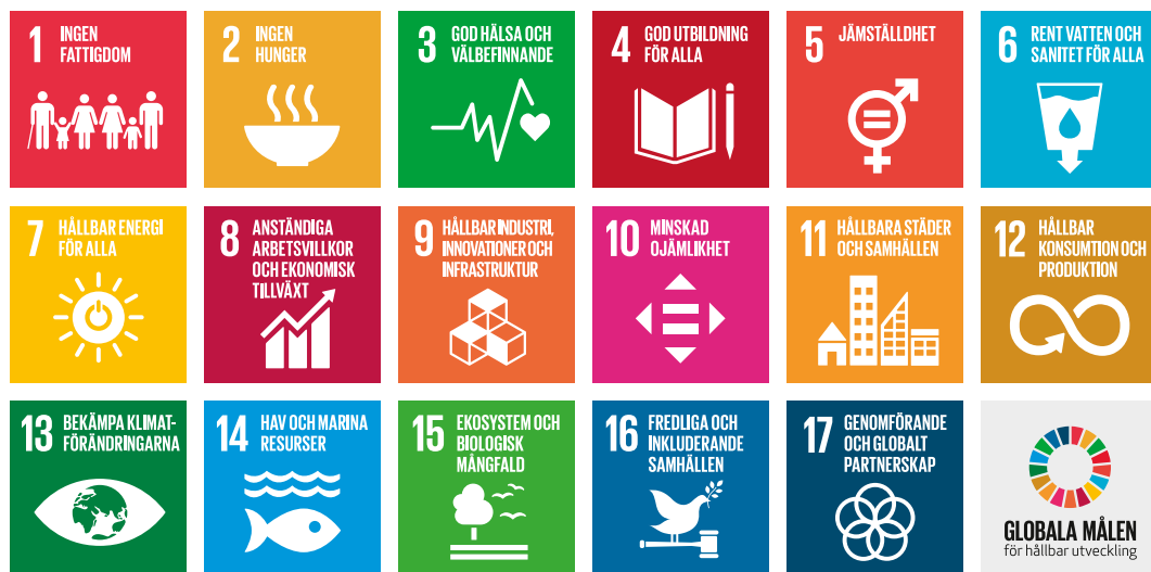
Bilden visar de globala målen inom Agenda 2030.